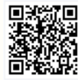
威海市职称评审申报指南（2022）

（六）其他职称申报有关情况请扫描二维码查看《威海市职称评审申报指南（2022）》